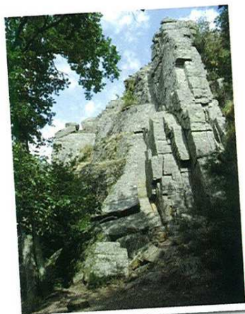
Site d'escalade à l'étang du Val

Ces plaques de schiste dressées sont d'anciennes clôtures qui délimitaient les champs, plus connues en Pays de Redon sous le nom de « palis ».