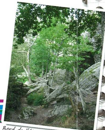
Bord de l'étang du Val